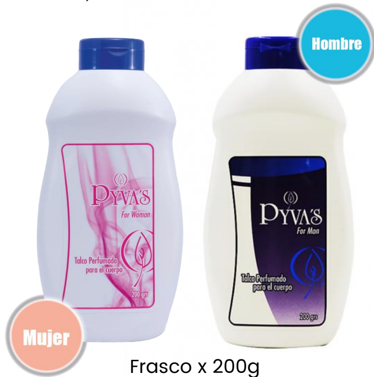
Frasco x 200g

Talcos para uso corporal con fragancia femenina y masculina. Brindan humectación y frescura, Son absorbentes.